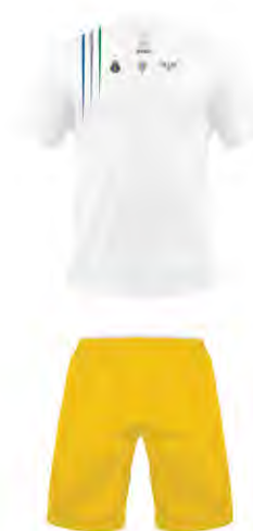
Ministério da Defesa